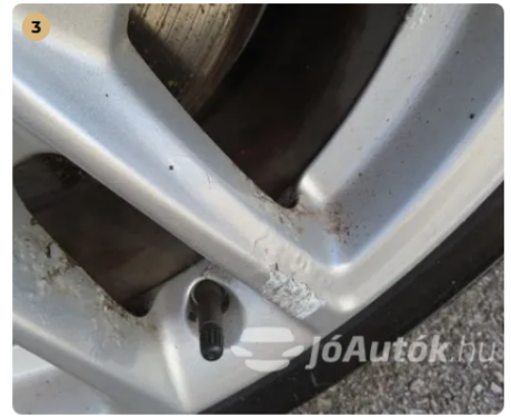
⚠ Felnik Felniken korrodáció látható.