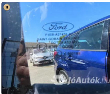
✓ Szélvédők, üvegek Oldalsó üvegen látható sérülés nincs. -