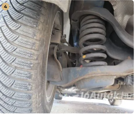
✓ Futómű A lengéscsillapítón olajfolyás nem észlelhető. -