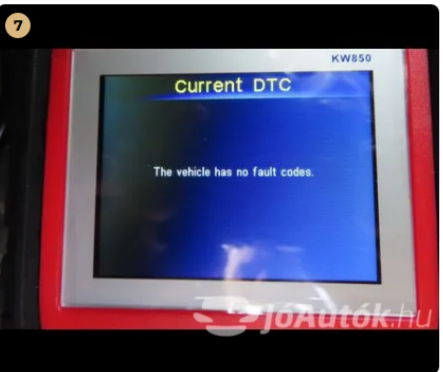
✓ Hibakód kiolvasása Számítógépes kiolvasás során nem találtam hibát. -