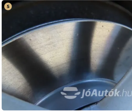
✓ Fékkrendszer A féktárcsa új. -