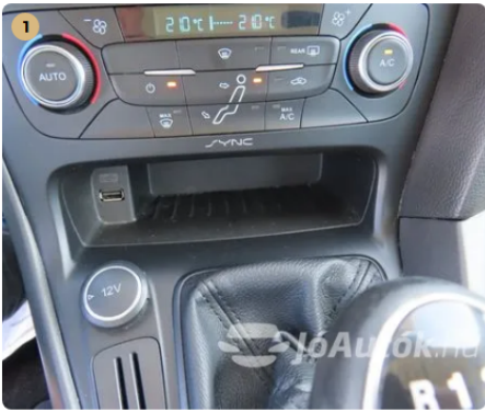
✓ Elektromos berendezések Műszerfalnyek megfelelően működnek. -