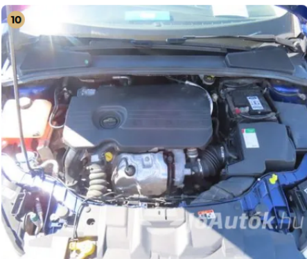
✓ Motor Motortérben olajfolyás nem látható. -