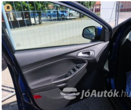
✓ Kárpitozás és belső burkolatok Az ajtókárpitok gyári állapotban vannak. -