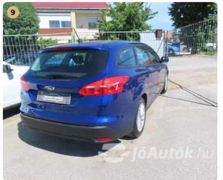
✓ Külső karosszéria elemek Műanyag lökhárítókön szemrevételezés alapján javításra utaló nyom nem látható. -