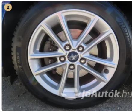
✓ Felnik Könnyűfém felni gyári. -