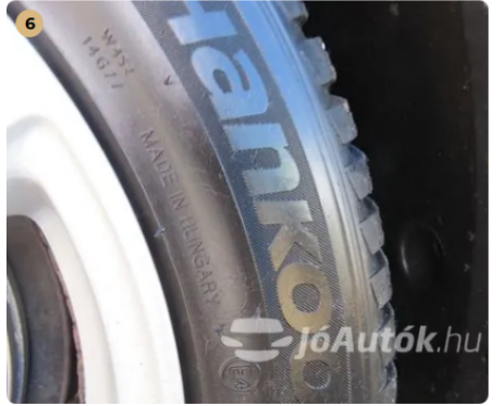
✓ Gumiabroncsok A gumiabroncsok odalfala nem repedezett. -