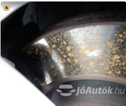
✓ Féktrendszer A féktárcsa megfelelő állapotban van. -