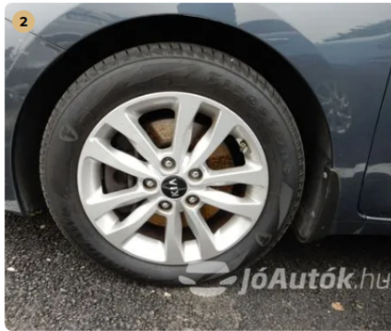
✓ Felnik Könnyűfém felni gyári. A piaci átlaghoz képest szebb állapotúak a felnik.