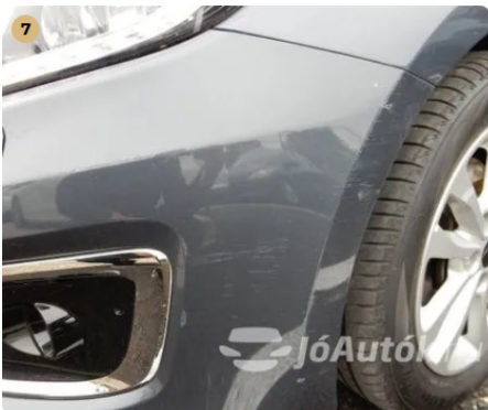
⚠ Külső karosszéria elemek Egyéb -