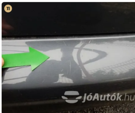
⚠ Külső karosszéria elemek Egyéb Normál használatból előfordul szinte