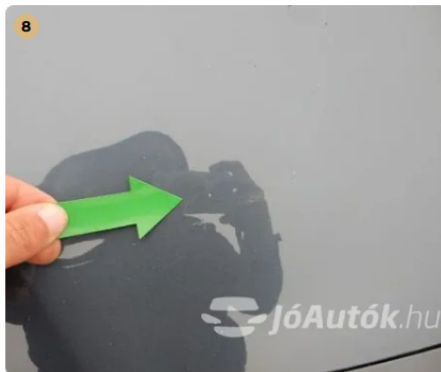
⚠ Külső karosszéria elemek Az autó használatából eredő apró kavicsfelverődések, hajszaíl karcok láthatóak. -