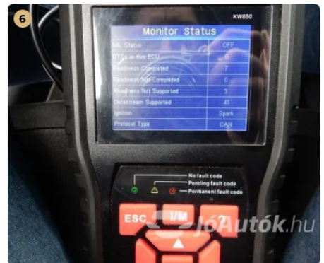
✓ Hibakód kiolvasása Számítógépes kiolvasás során nem találtam hibát. -