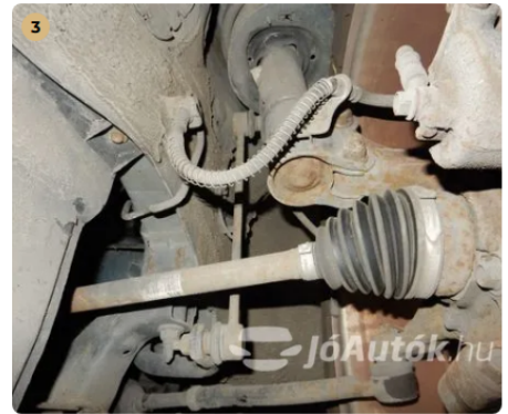
✓ Futómű A féltengelyen zsíros / olajos kicsapódás nem látható. -