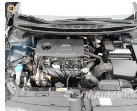
✓ Motor Motortérben olajfolyás nem látható. -