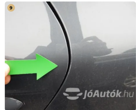
⚠ Külső karosszéria elemek Egyéb -