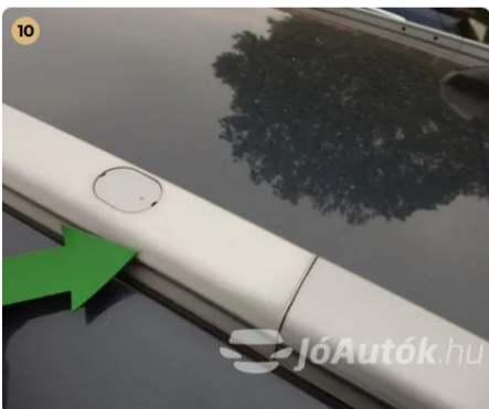
⚠ Külső karosszéria elemek Egyéb -