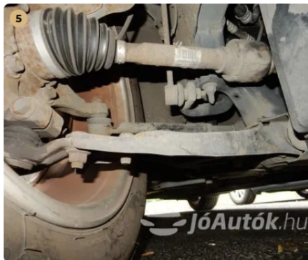
✓ Hajtás A féltengely gumiharangoknál szakadást nem észleltem. -