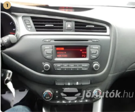
✓ Elektromos berendezések Egyéb -