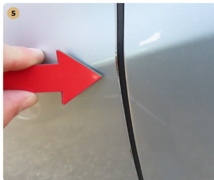
⚠ bal első ajtó fényesülés