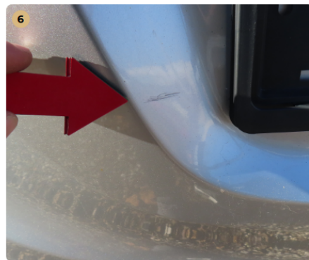
⚠ hátsó lökhárító horzsolás, rozstda pötty