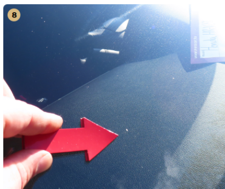
⚠ első szélvédő kavicsos