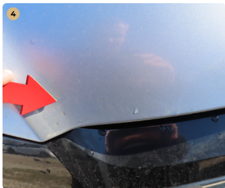
⚠ motorháztető kőfelverődéses