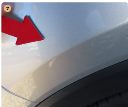
⚠ jobb hátsó sárvédő karcos