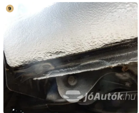
⚠ Fújásnyomok a küszöbökön