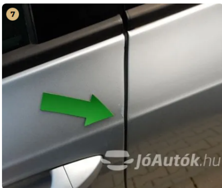
⚠ Karc a bal első ajtó peremen