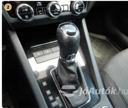
⚠ Kopott váltógomb