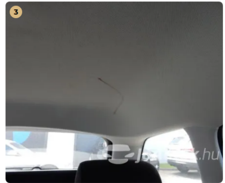
⚠ Szennyeződés a tetőkárpiton