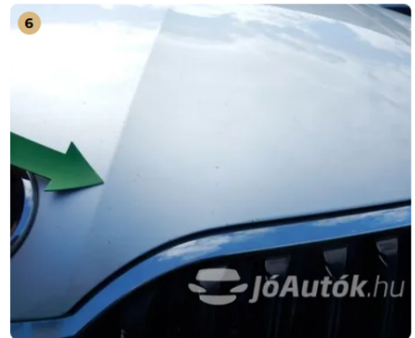
⚠ Motorháztetőn kavicsnyomok