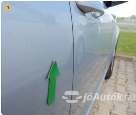
⚠ Jobb hátsó ajtón apró horpadás