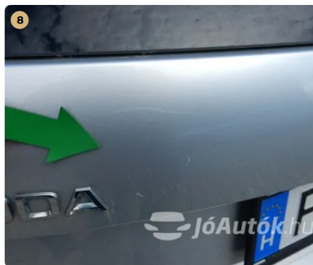
⚠ Karc a csomagterfedélen