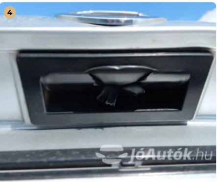
⚠ Csomagtér nyitógom gumi burkolat szakadt