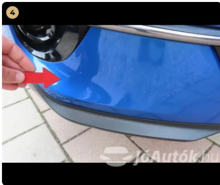
4 első véshárító nagyon apró kavics sérülések