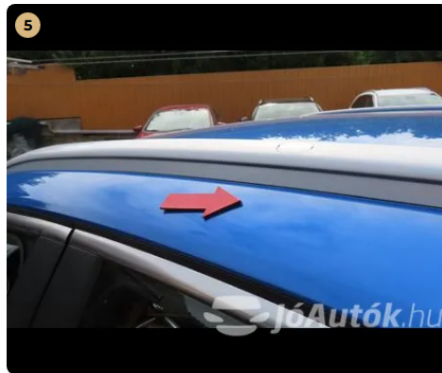
5 bal oldali B oszlopnál pici horpadás