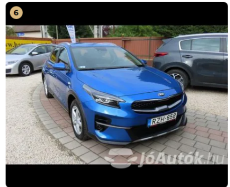
6 fényezés újszerű, gyári