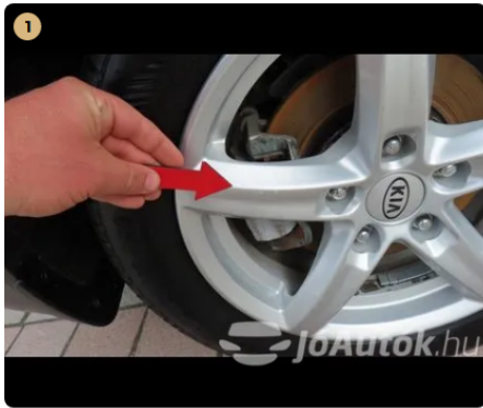
1 bal első és jobb első felnin enyhe horzsolás