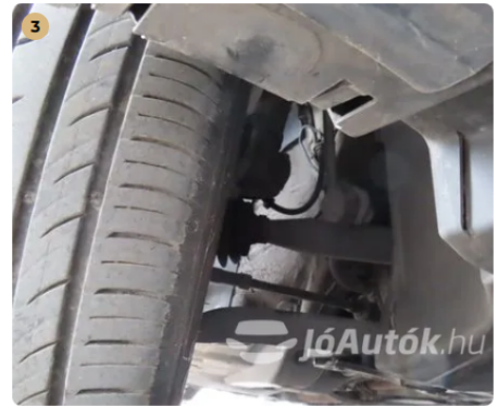
3 porszáraz féltengelyek