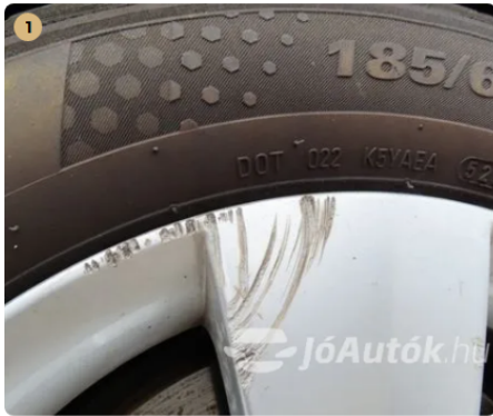
1 felni karcos