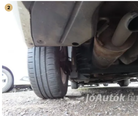
2 száraz lengéscsillapítók