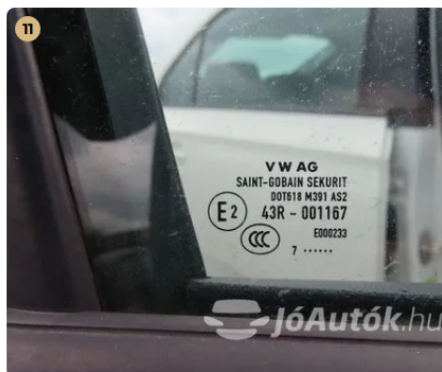
11 gyári üvegek körbe