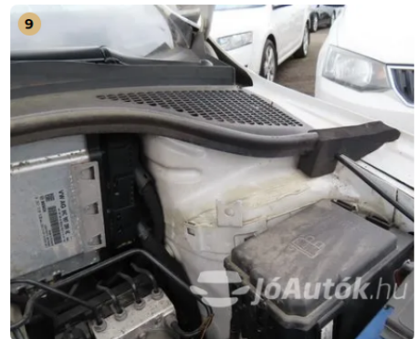
9 gyári doblemezek