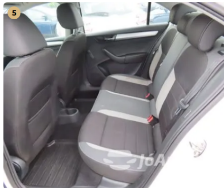
5 megkímélt szép utastér