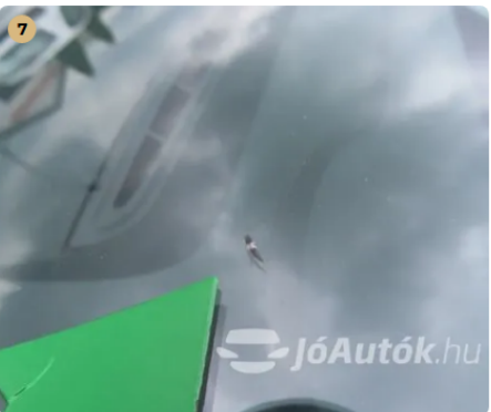
7 első szélvédőn kavics felverődés érdemes javítatni