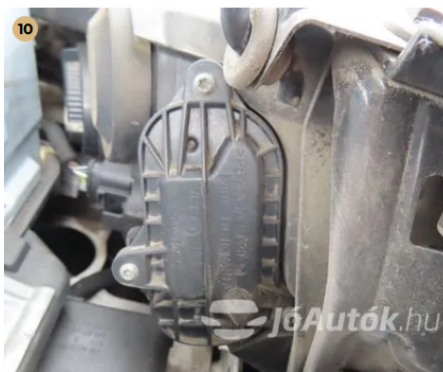
10 gyári lámpák