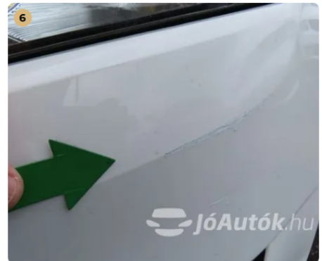
6 első lökhárítón karcolás