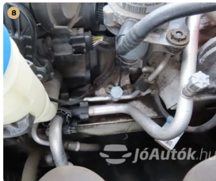
8 gyári nyúlványok