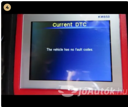
4 nincs hibakód