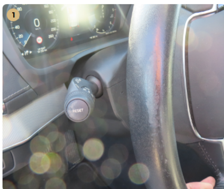
1 műszerfal kormány kopott