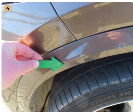
4 bal első sárvédő fény sérülések apró horpadás