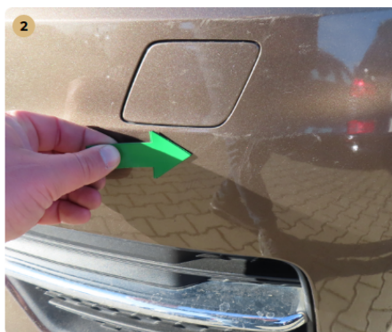
2 első lökhárító kavics sérülések