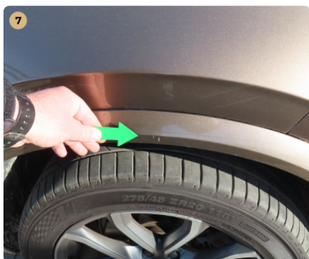
7 jobb első sárvédő fény sérülések