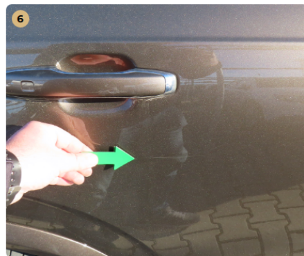
6 jobb hátsó ajtó karc fény sérülés