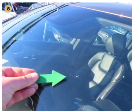
8 első szélvédő pár apró köfelverődés