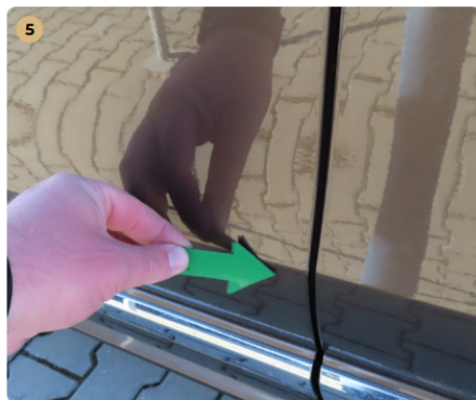
5 bal első ajtó karc fény sérülés