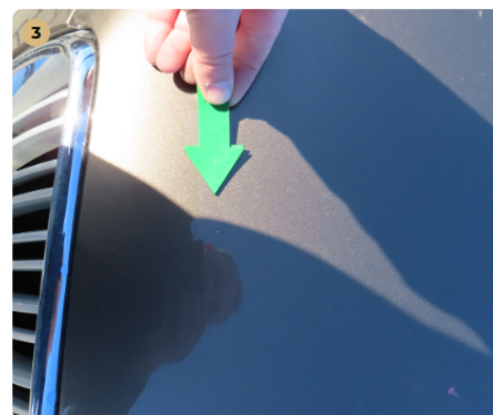
3 motorháztető enyhén kavics sérült