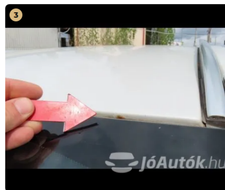
⚠ tető, szélvédő feletti rész kavics sérülés, enyhe korrozio