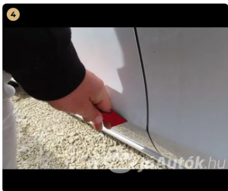
! bal első ajtó fény sérülés, ajtó rányitás