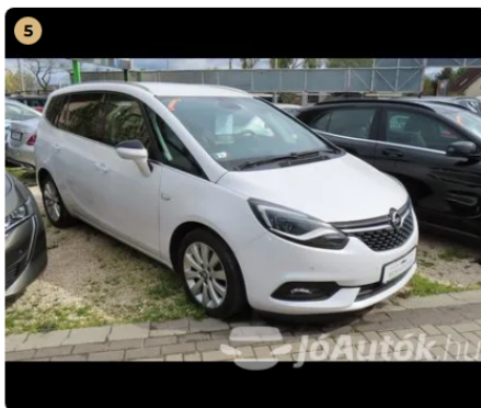
✓ fényezés kiváló állapotban