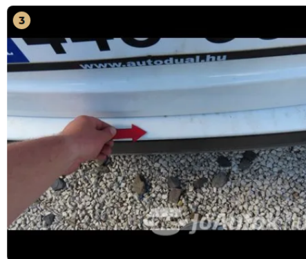
⚠ hátsó véshárító karcos