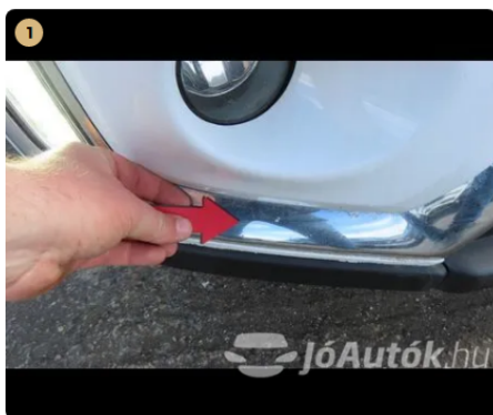
⚠ első véshárító apró fénysérülések