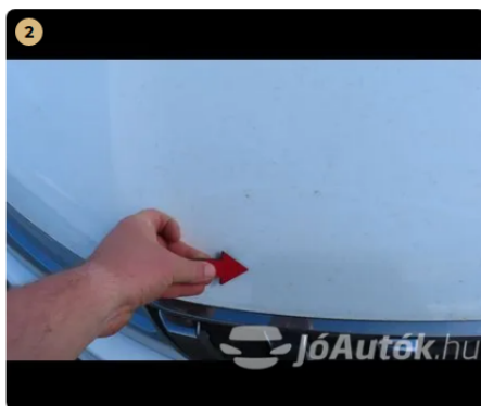
⚠ motorháztető kavics sérülések