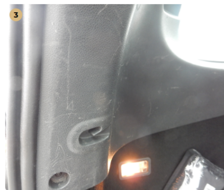
3 Csomagtartó Karcolás a burkolaton