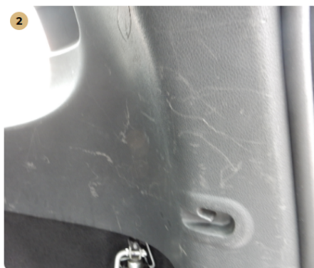
2 Csomagtartó Karcos burkolat