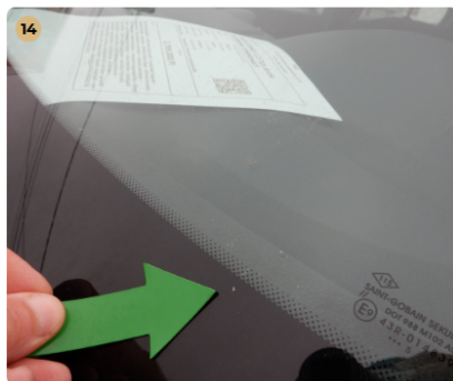
! első szélvédő