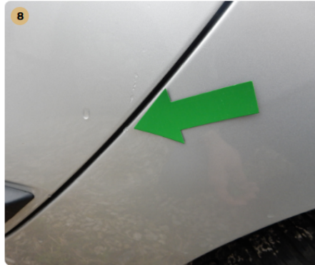
bal hátsó sárvédő