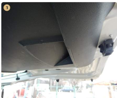
1 Csomagtartó Karc a burkolaton