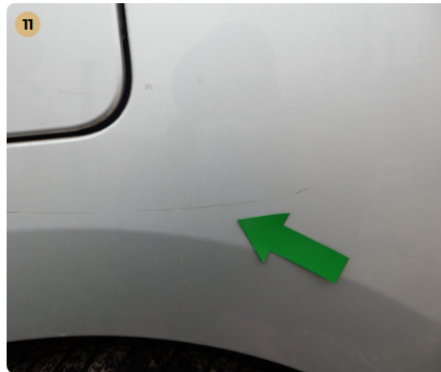
jobb hátsó sárvédő