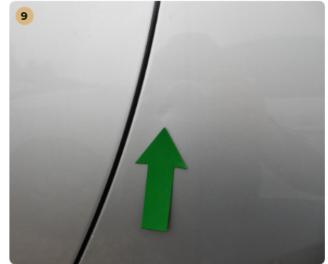
bal hátsó sárvédő