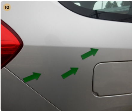
jobb hátsó sárvédő