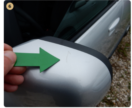
bal első ajtó