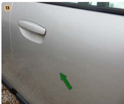
! jobb első ajtó