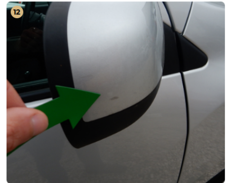
jobb első ajtó