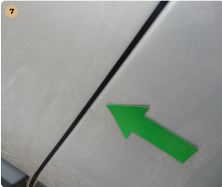
bal hátsó ajtó