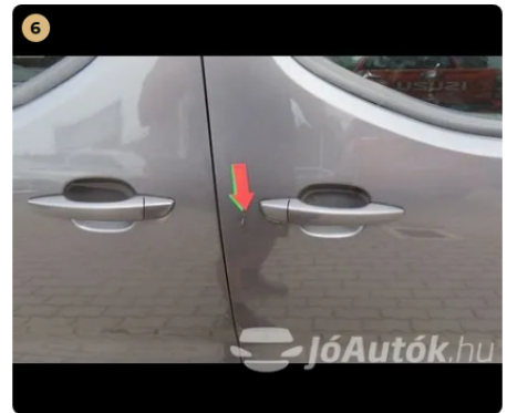
6 jobb első ajtó karc, fény sérülés