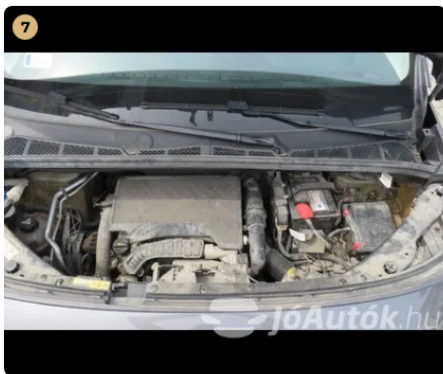
7 motortér szennyezett