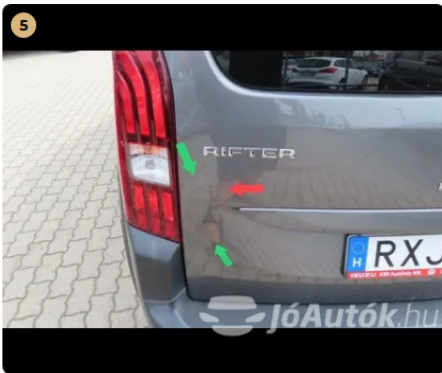
5 csomagtér ajtó horpadt, fény sérült, javítás nyomai láthatóak