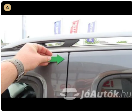
4 bal első ajtó fény sérülések