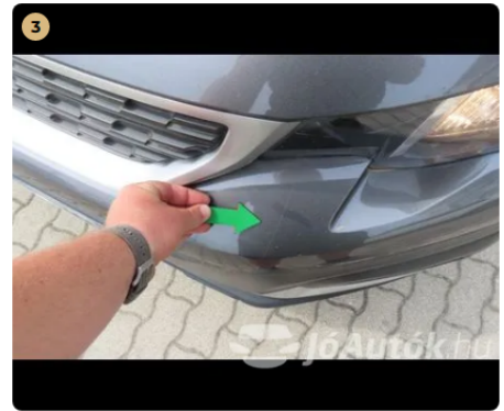
3 első véshárító kavics sérülések