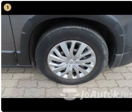
1 gumiabroncsok futófelület ki van repedezve, öregek