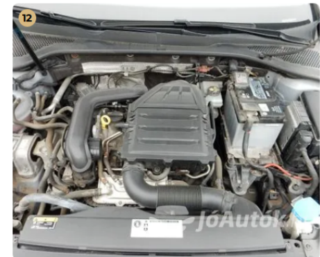
✓ Motor Motortérben olajfolyás nem látható. -