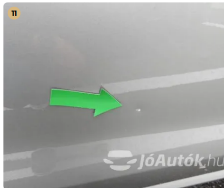
⚠ Külső karosszéria elemek Egyéb -