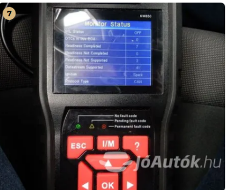
✓ Hibakód kiolvasása Számítógépes kiolvasás során nem találtam hibát. -