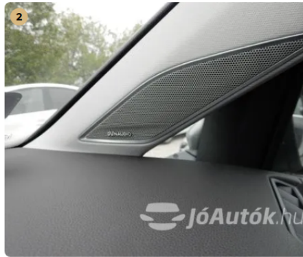
✓ Extra tartozékok és felszereltségek Egyéb -