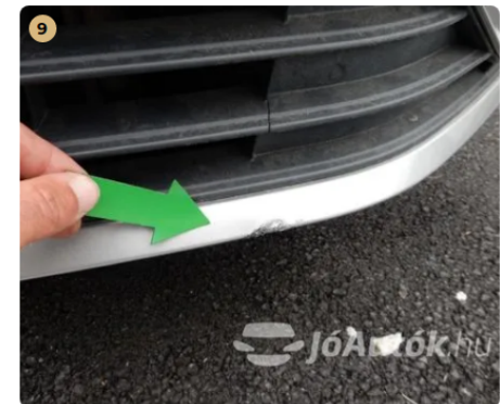
⚠ Külső karosszéria elemek Egyéb -