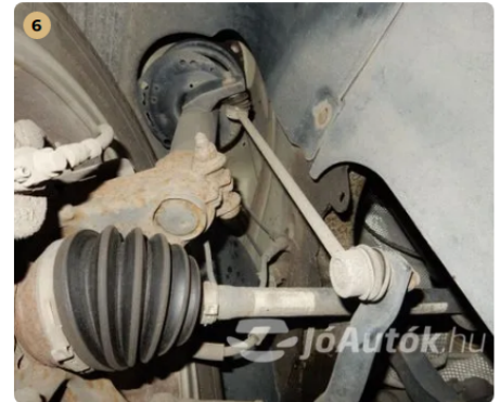
✓ Hajtás A féltengely gumiharangoknál szakadást nem észleltem. -