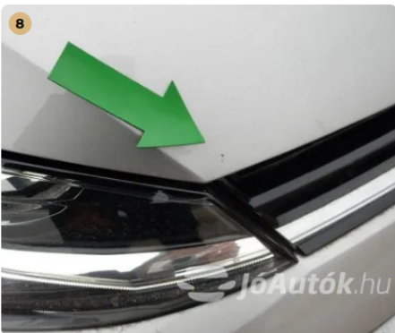
⚠ Külső karosszéria elemek Az autó használatából eredő apró kavicsfelverődések, hajszál karcok láthatóak. -