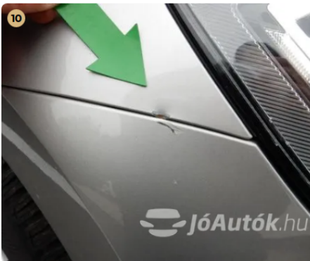
⚠ Külső karosszéria elemek Egyéb -