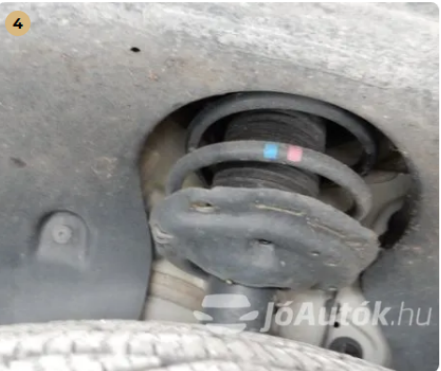
✓ Futómű A lengéscsillapítón olajfolyás nem észlelhető. -