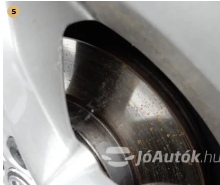
✓ Fékkrendszer A féktárcsa megfelelő állapotban van. -