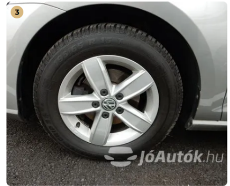
✓ Felnik Könnyűfém felnin patkázás nyomai nem láthatóak. -