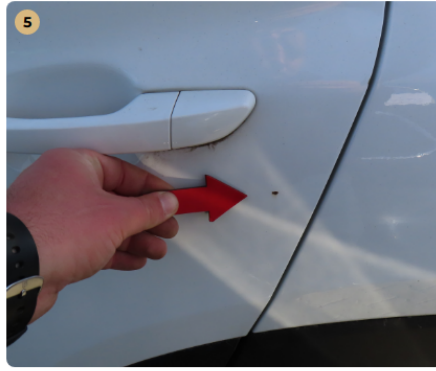
5 bal hátsó ajtó rozsdapötty, fénysérülés