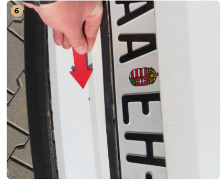
6 hátsó lökhárító karcos