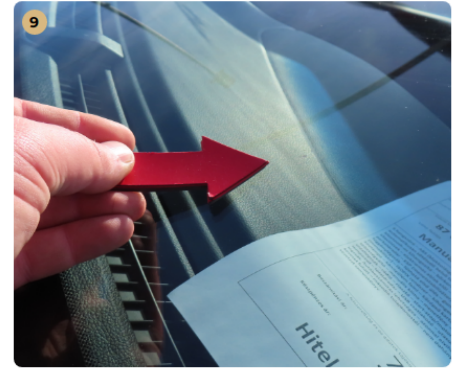
9 első szélvédő apró kavics sérülések