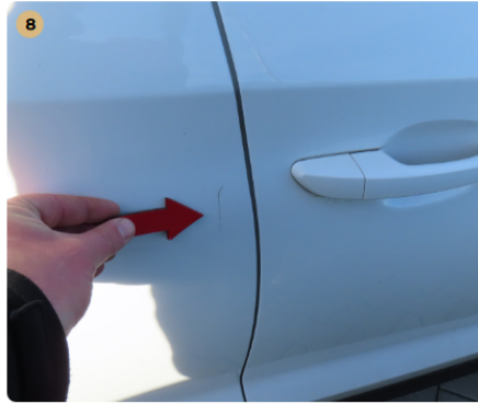
8 jobb első ajtó fénysérülés