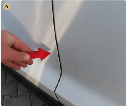
4 bal első ajtó fénysérülés