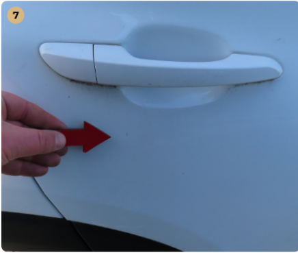
7 jobb hátsó ajtó karc