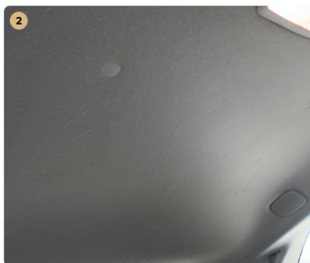
⚠ tetőkárpit szennyezett