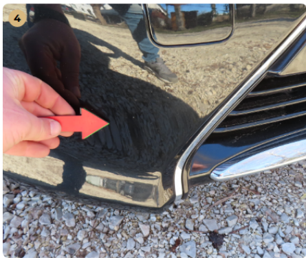
! első lökhárító kavics sérülések