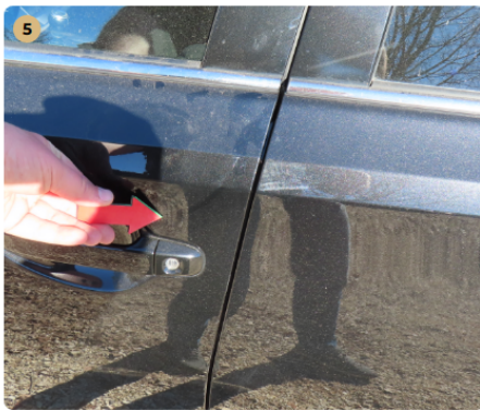
! bal első ajtó fény sérülés