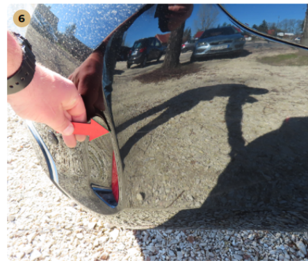
! hátsó lökhárító karcos