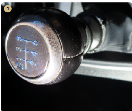
⚠ mûszerfal váltógomb kopott