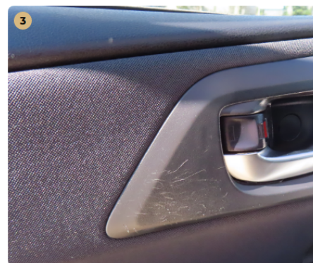
⚠ bal első ajtókárpit karcos