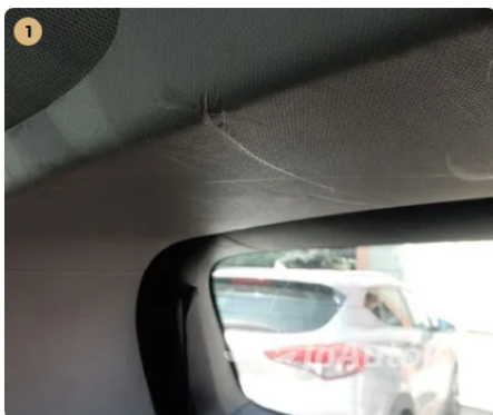
⚠️ Karc a csomagtér burkolaton