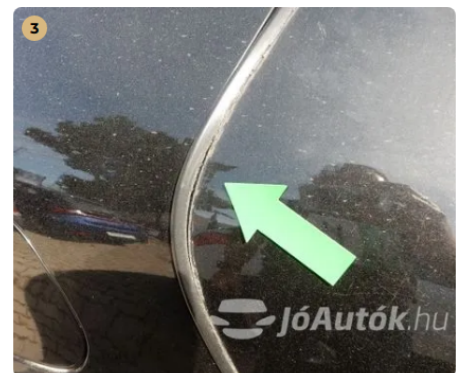
⚠️ Élvédő csúnyán van felragasztva