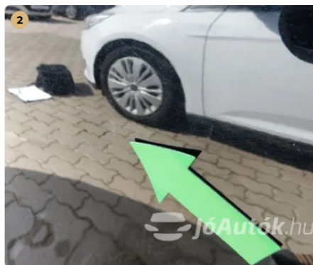
⚠️ Apró karc a bal első ajtón