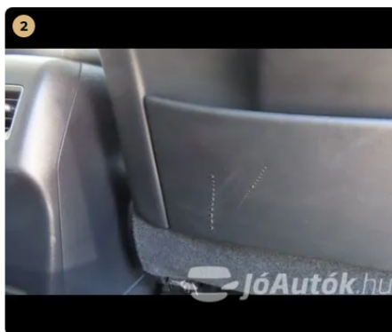
⚠ első ülések hát támlája karcos, sérült