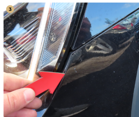
⚠ első lökhárító műanyag horzsolt, kavicsos, fénysérült