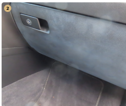
⚠ műszerfal szennyezett