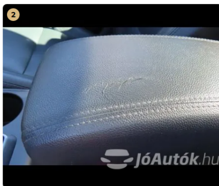
⚠️ középső kartámasz kopott