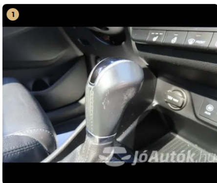
⚠️ váltógomb kopott