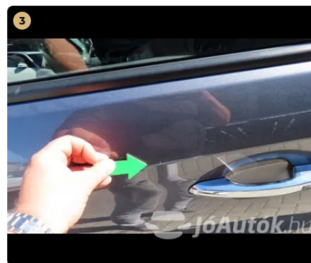
⚠️ bal első ajtó karc fény sérülés