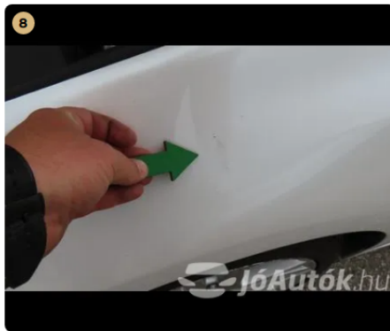
⚠ Külső karosszéria elemek Az autó használatából eredő apró kavicsfelverődések, hajsza karcok láthatóak. bal első sárvédőn, bal első ajtón, és bal hátsó sárvédőn használatból adódó, karcok és fénysérülések találhatók