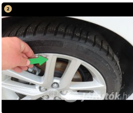
⚠ Felnik Könnyűfém felnin patkázás nyomai láthatóak. enyhe használatból eredő hibák, horzsolások