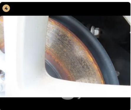
✓ Fékrendszer Féktárcsán állásból adódóan felületi korrózió látható, ami rövid használat után lekopik. -