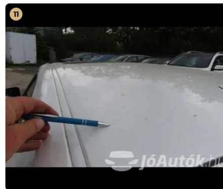
⚠ Külső karosszéria elemek Egyéb horpadás