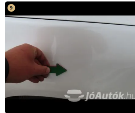
⚠ Külső karosszéria elemek Egyéb horpadás