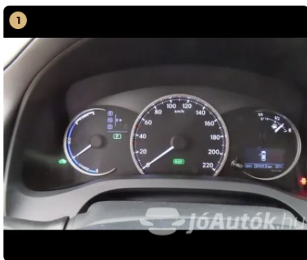
✓ Elektromos berendezések Műszerfalfények megfelelően működnek. -