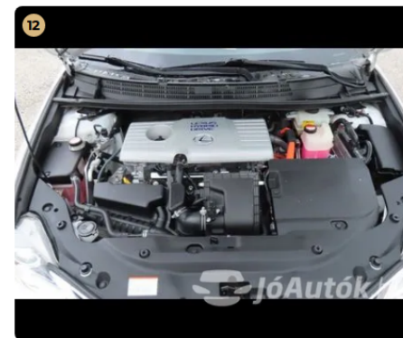
✓ Motor A hűtőfolyadék színe megfelelő. -