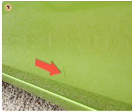
7 bal első ajtó Karc