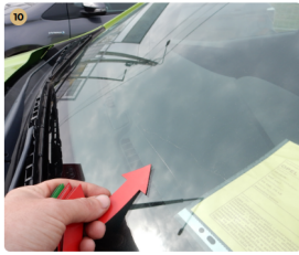
10 első szélvédő Karc az első szélvédőn