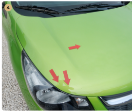
4 motorháztető Kavicsnyomok több helyen