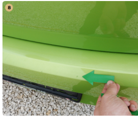
8 hátsó lökhárító Kisebb sérülések