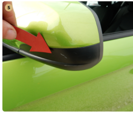
5 bal első ajtó Karc a tükrön