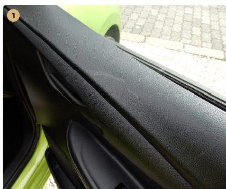
! jobb első ajtókárpit