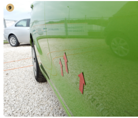
9 jobb első ajtó Apró horpadások