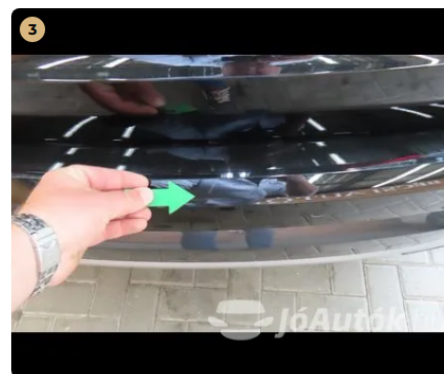
⚠ hátsó vészháritó enyhe karc