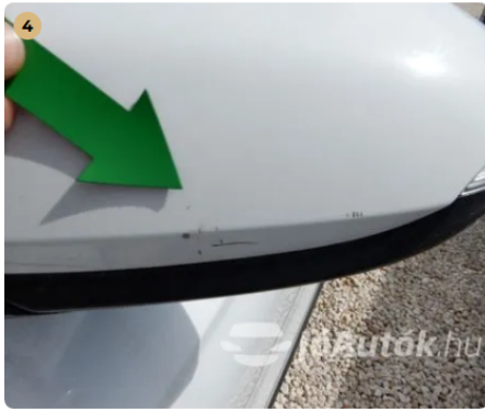
! Karcok a bal első tükrön