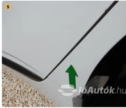
! Horpadás a bal hátsó sárvédőn