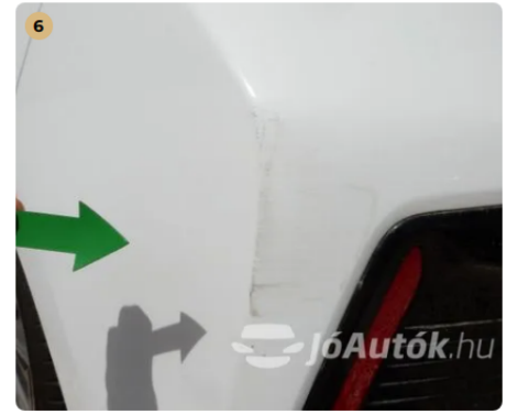
! Horcsolás a hátsó lökhárítón