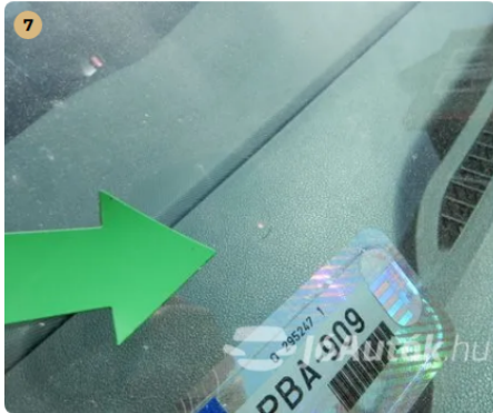
! Kavicsfelverődés az első szélvédőn