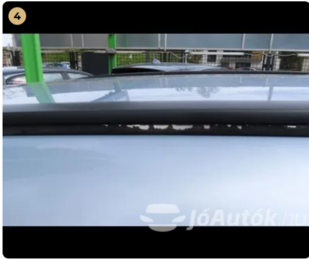
⚠ jobb oldali tetősín festék hiba