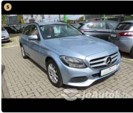
✅ külső karosszéria, fényezés korához képest kiemelkedő állapotban