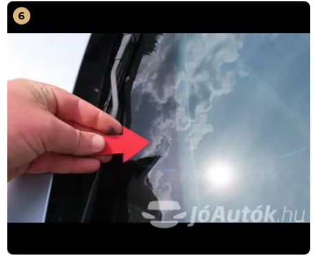
⚠ első szélvédő apró kavics sérülések