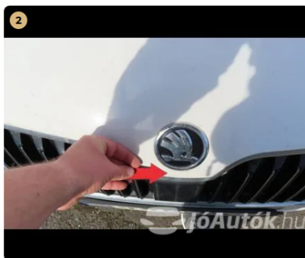
⚠ motorháztető apró kavics felverődés