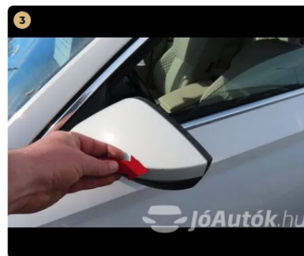
⚠ bal első visszapillantó enyhén horzsolts