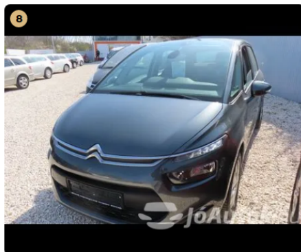
✓ első szélvédő szép állapotú, kavics mentes