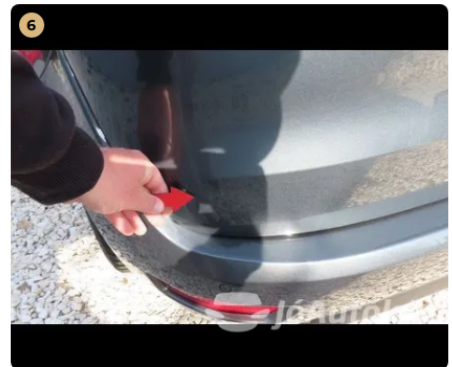
! hátsó vészharító fény sérülés