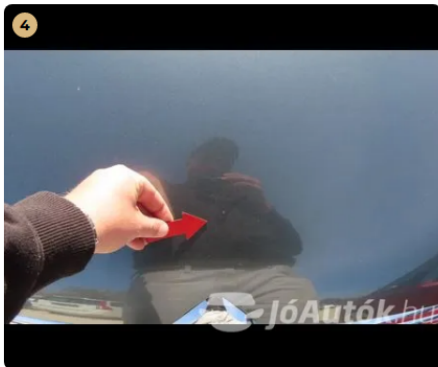
! motorháztető apró kavics felverődések