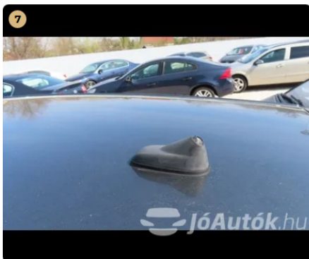
! antenna hiányzik