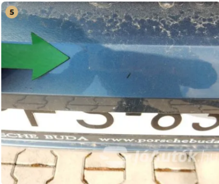
⚠ Karcok a hátsó lökhárító rakodóperemén