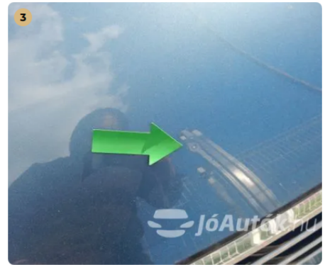
⚠ Kavicsnyomok a motorháztetőn