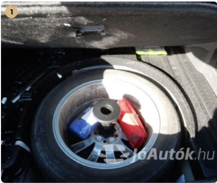
✓ Teljes értékű pótkerék