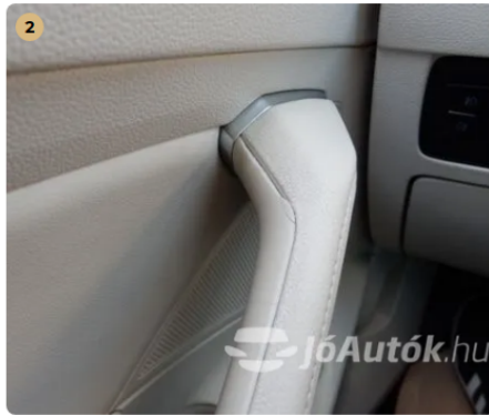
⚠ Apró sérülés a sofőr oldali ajtóbehúzáson Típusbetegség