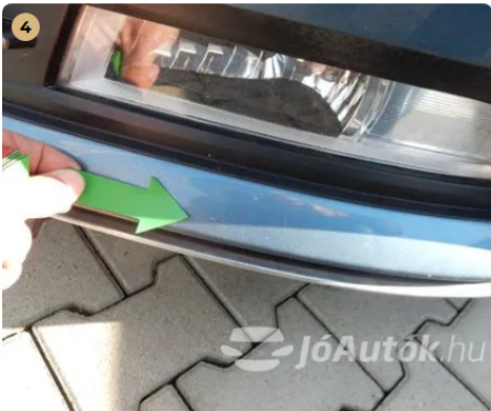
⚠ Kavicsnyomok az első lökhárítón