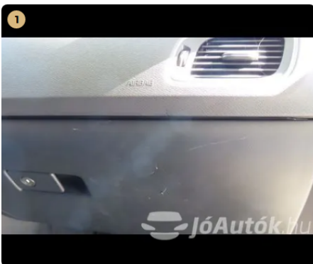
⚠ kesztyűtartó karcos