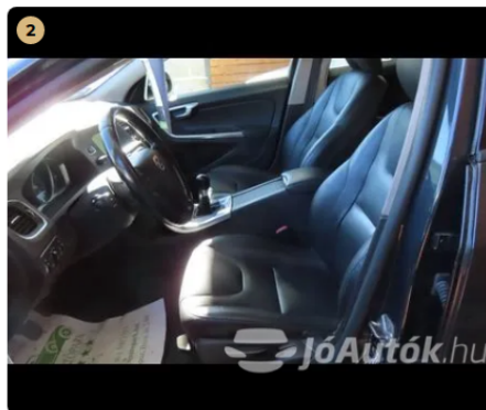
✓ belső kárpitozás kiváló állapotú