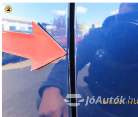
Bal első ajtó

Kavicsfelverődés miatt apró fény sérülések