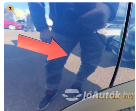
Bal hátsó ajtó