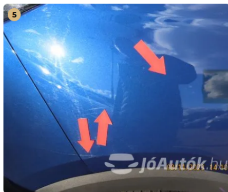
! Jobb hátsó ajtó