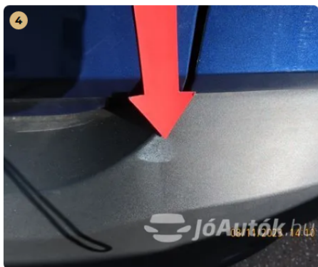
! Hátsó lökhárító