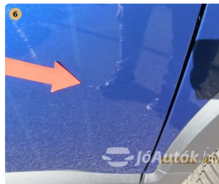
! Jobb első ajtó