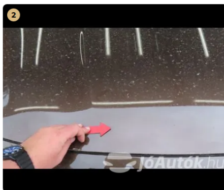
⚠ motorháztető kavics sérülések