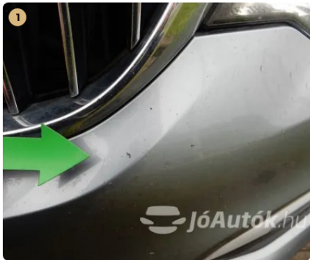
⚠ Kavicsnyomok az első lökhárítón