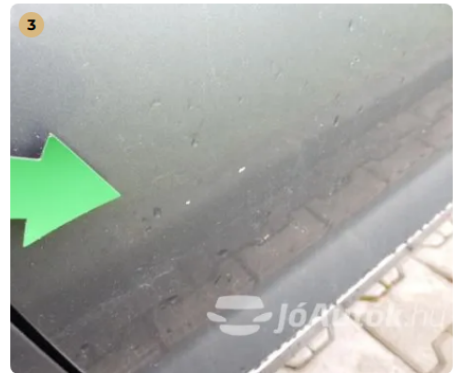
⚠ Bal első ajtón rányitási karc