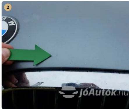
⚠ Kavicsnyomok a motorháztetőn