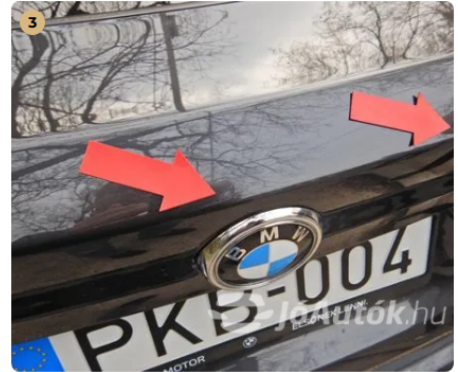
⚠ Apró horpadások a csomagtér ajtón