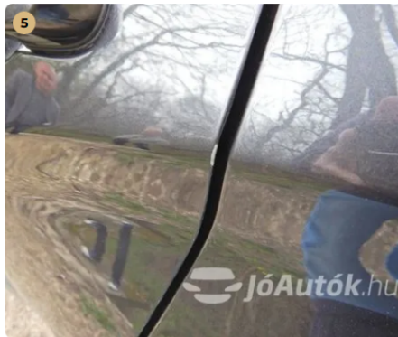
⚠ Ajtó peremnél sérülés