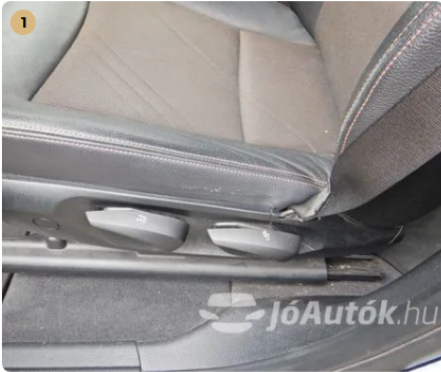
⚠ Kopás a sofőrülésen