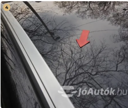
⚠ Apró horpadás a tetőn