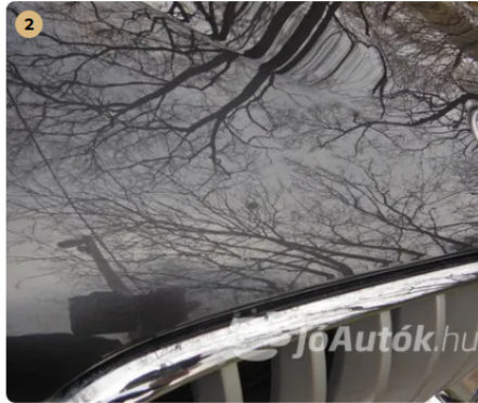
⚠ Apró kavicsnyomok a motorháztetőn