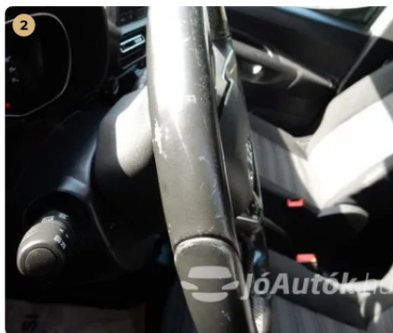
⚠ Karcok a kormányon