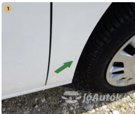
⚠ Apró sérülés a jobb első sárvédőn