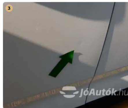
⚠ Apró horpadás a bal első ajtón