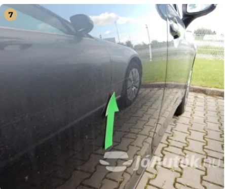
7 Polírozással eltüntethető karc az autó jobb oldalán