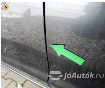
5 Kopások a bal első ajtó peremén