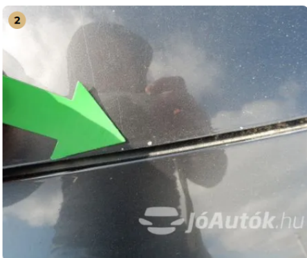
2 Motorháztetőn kavicsnyomok