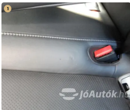
1 Nagyon apró sérülés a hátsó ülőlapon