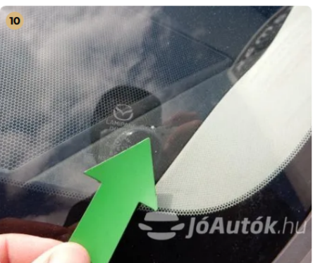
10 Apró kavicsfelverődé a szélvédő sarkában