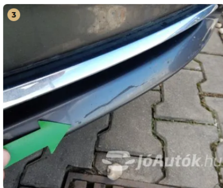
3 Karc az első lökhárítón