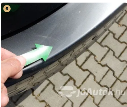
6 Karcok a hátsó lökhárító rakodóperemén