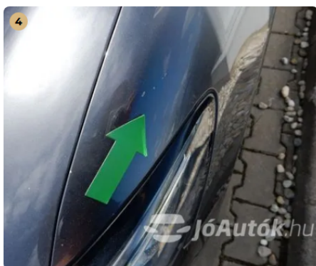
4 Kavicsnyomok a bal első sárvédőn