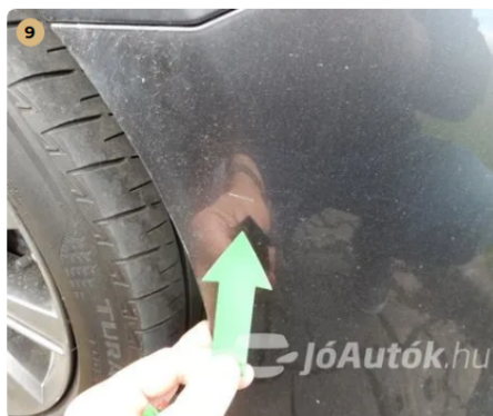
9 Karcok az első lökhárítón