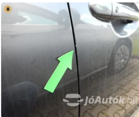
8 Kopás a jobb első ajtó peremén