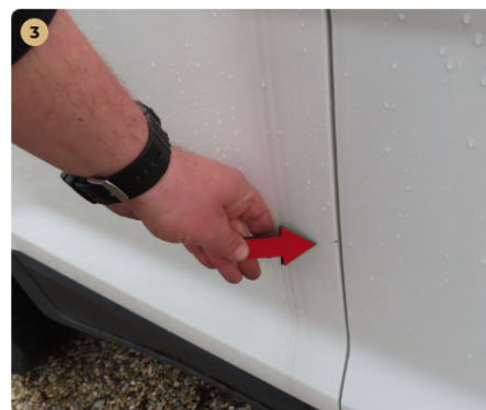
⚠ jobb első ajtó fény sérülés