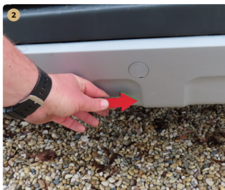
⚠ hátsó lökhárító horzsolt, enyhén karcos