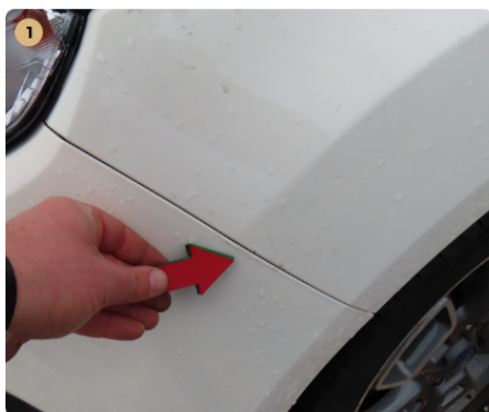
⚠ bal első sárvédő apró köfelverődések