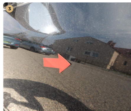
! bal első ajtó