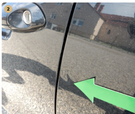
! bal hátsó ajtó