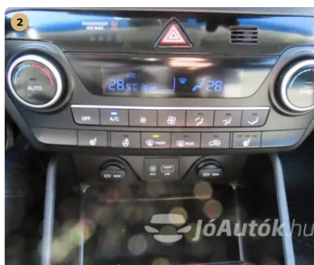
2 két zónás digit klíma