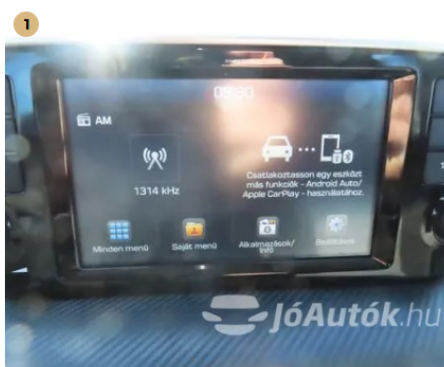
1 Design led kijelző