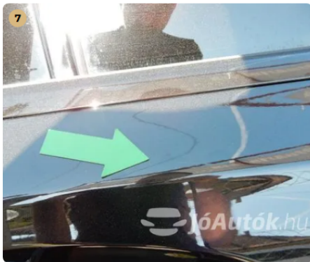
⚠ Karc a jobb hátsó ajtón