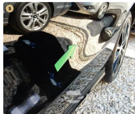
⚠ Kisebb sérülés a bal hátsóajtón