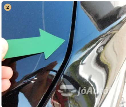
⚠ Kavicsfelverődés nyomok a motorháztetőn