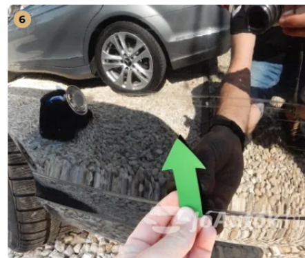
⚠ Húzásnyom a hátsó lökhárítón