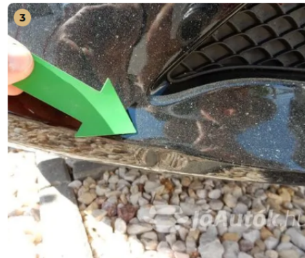
⚠ Kisebb sérülés az első lökhárítón