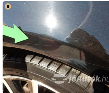
⚠ Karc a jobb első sárvédőn