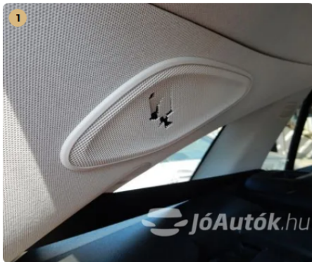
⚠ Csomagtér hangszórórács sérült