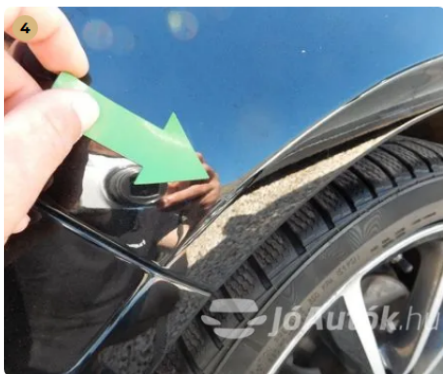
⚠ Kisebb sérülés a bal első sárvédőn