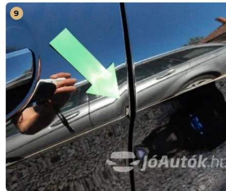
⚠ Kisebb sérülés a sofőrajtó peremén