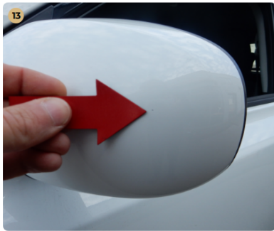
13 bal első ajtó Kavicsnyom a tükrön