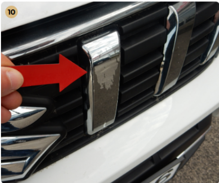
! első lökhárító Kopás