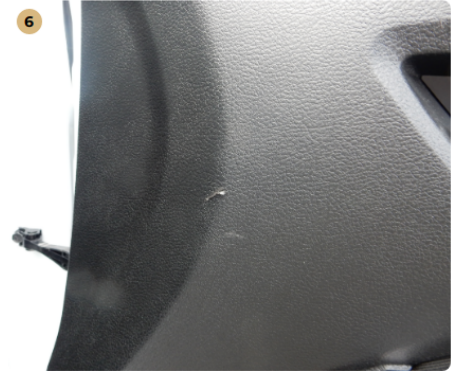
! jobb első ajtókárpit Kisebb sérülés