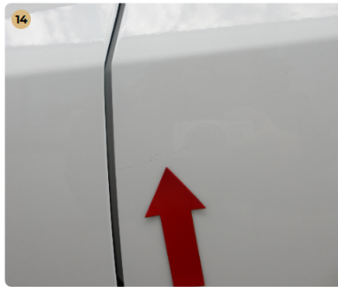
14 bal első ajtó Karcolás