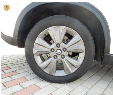
⚠️ jobb hátsó felni