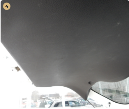
! Csomagtartó Karcos burkolat