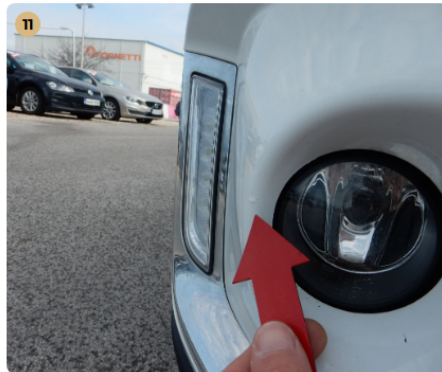
! első lökhárító Kavicsnyom