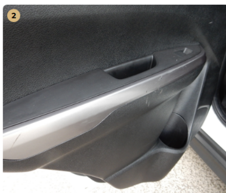
⚠️ bal hátsó ajtókárpit