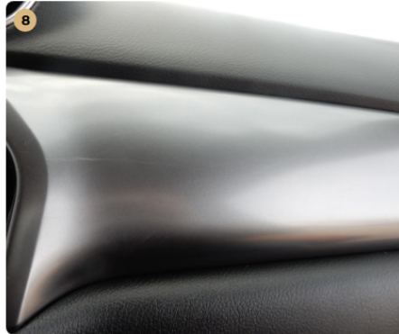
! műszerfal Karcolások