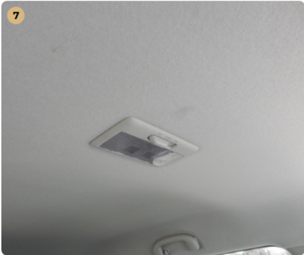
! tetőkárpit Kisebb szennyeződés