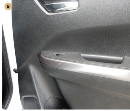
! jobb hátsó ajtókárpit Karcos burkolat