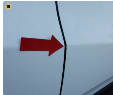
18 jobb első sárvédő Apró sérülés