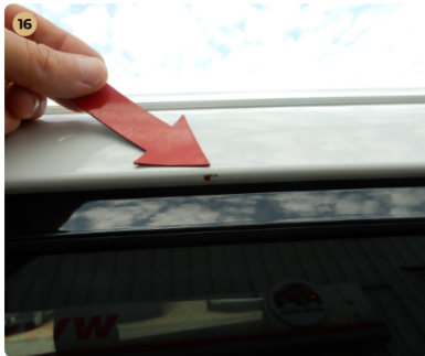
16 tető Kisebb sérülés