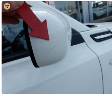
17 jobb első ajtó Karcos tükör