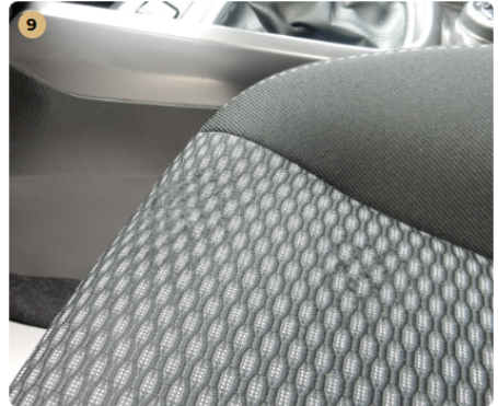
! bal első üléskárpit Kopások