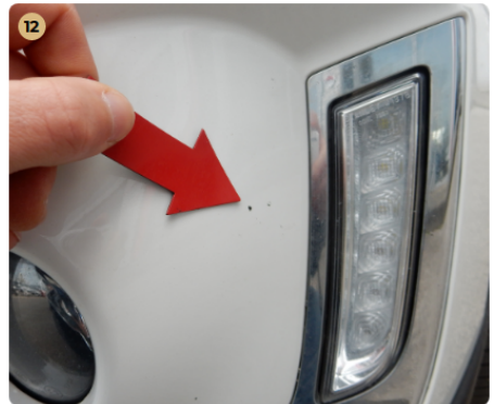
! első lökhárító Kavicsnyomok több helyen