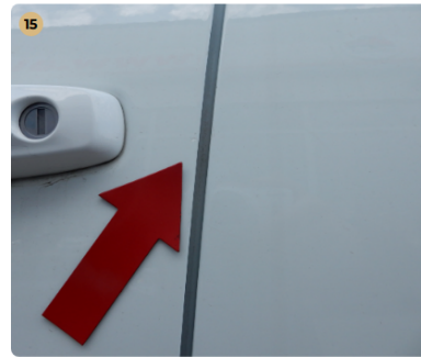
15 bal első ajtó Kavicsnyom