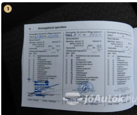
1 Vezetett szervizkönyv