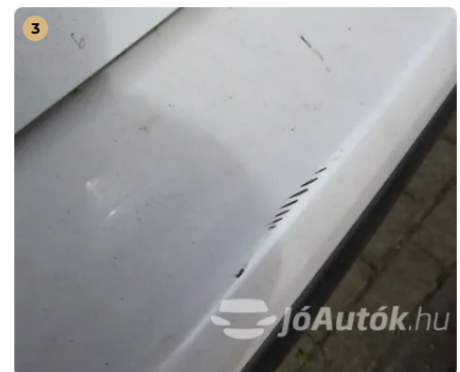
3 Hátsó lökhárító javítást nem igényel!