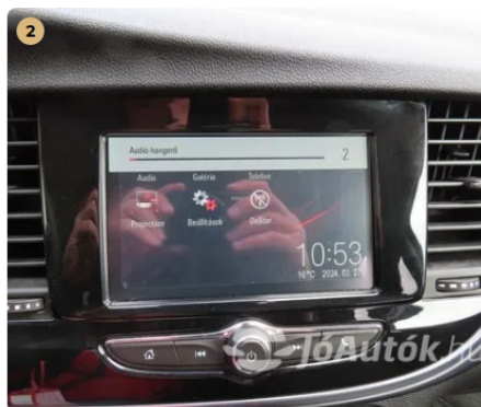
2 Led kijelző