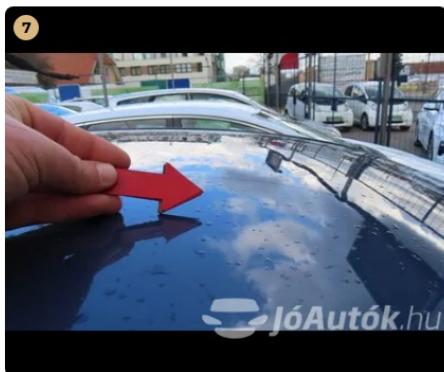
! tető apró horpadás