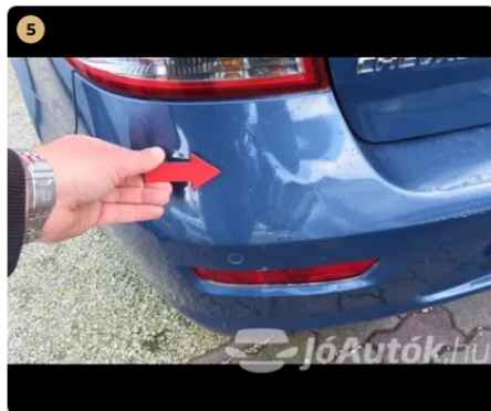
! hátsó vészféklátó több horzsolás és fény sérülések