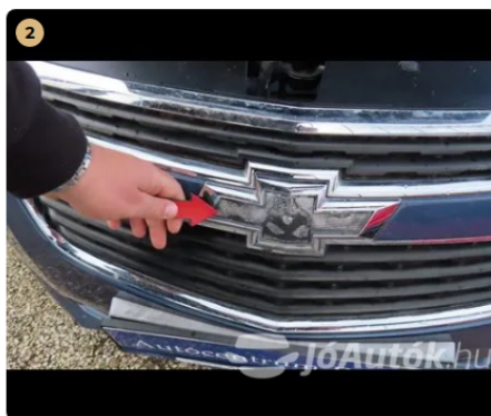
2 első vészháritó kavics sérülések és fény sérülések