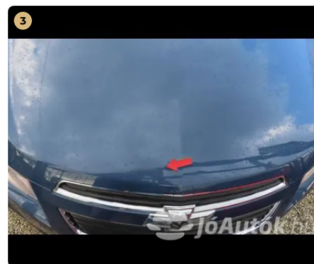
3 motorháztető apró horpadás