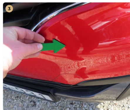
! első lökhárító apró kavics sérülések