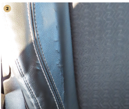
! bal első üléskárpit kirepedezett