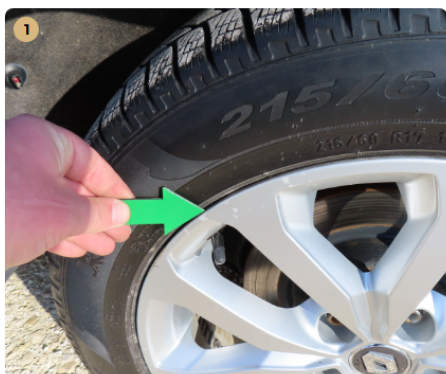
! bal első felni horzsolt