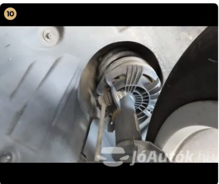
✓ Utascella és gyűrődő zónák A kerékjáratnál a szigetelés és a patentolás gyári. -