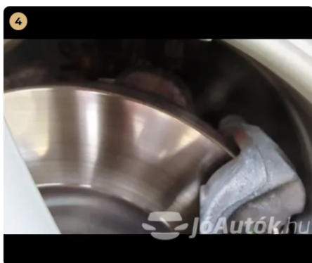
✓ Férendszer A féktárcsa megfelelő állapotban van. -