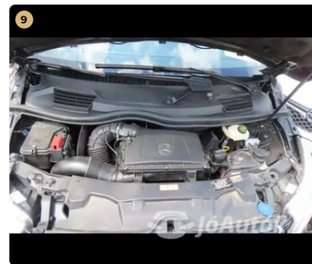
✓ Motor Motortérben olajfolyás nem látható. -