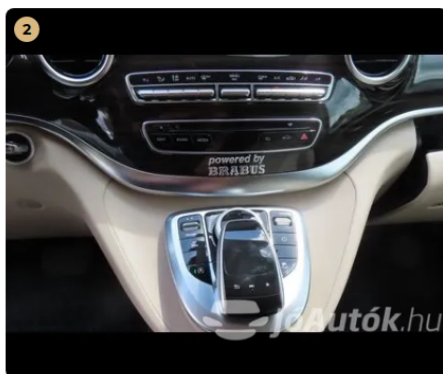
✓ Elektromos berendezések Gombvilágítások megfelelően működnek. -