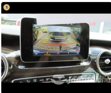
✓ Elektromos berendezések Műszerfalények megfelelően működnek. -