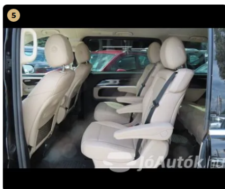
✓ Kárpitozás és belső burkolatok A bőr/alcantara kifogástalan állapotú. -