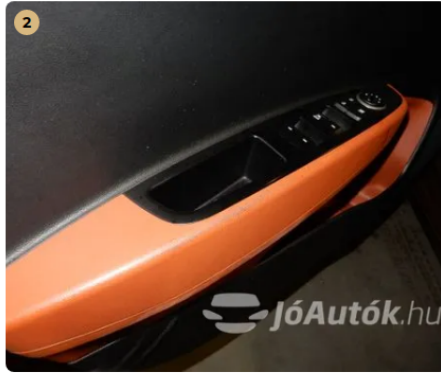
⚠ Kárpitozás és belső burkolatok