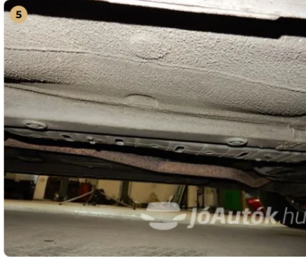
✓ Utasegély és gyűrődő zónák