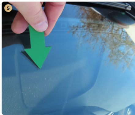
! első szélvédő apró kavics sérülések