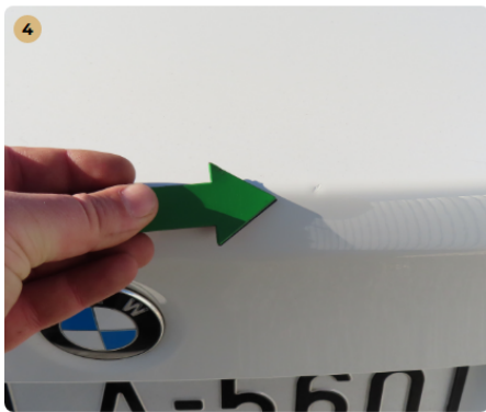
! csomagtartótető fény sérülések (javítva)