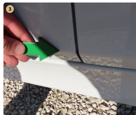
3 bal első ajtó fény sérülés