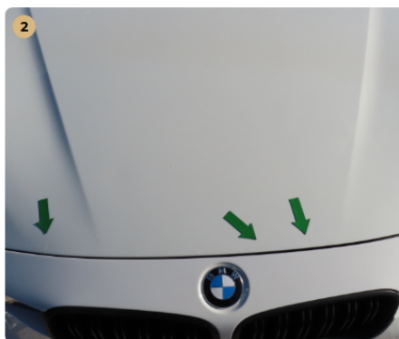
2 motorháztető Karcok kavics felverődések (javítva)