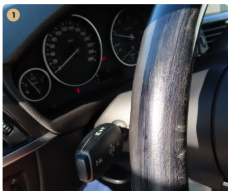
1 műszerfal kormány kopott