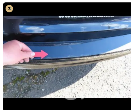
⚠ hátsó vészharító karcos