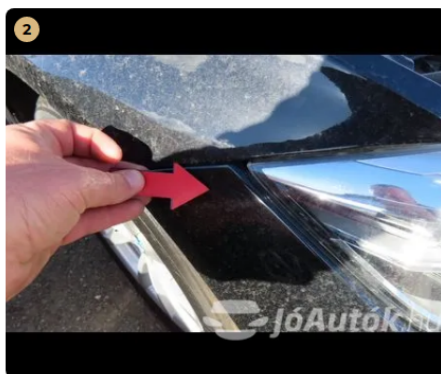
⚠ első vészharító apró fény sérülés