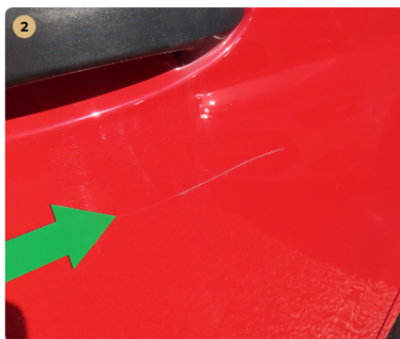
! jobb hátsó ajtó