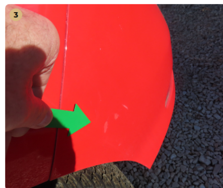
! hátsó lökhárító