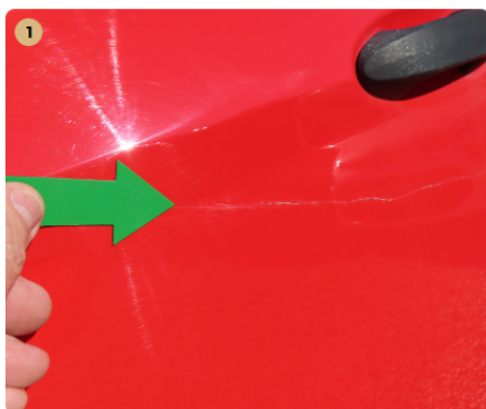
! bal első ajtó