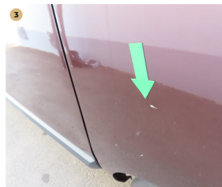
3 bal hátsó ajtó Leverődés