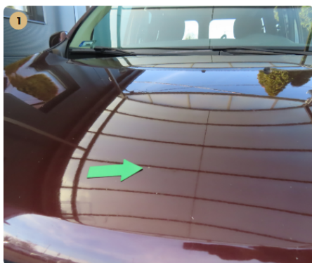
1 motorháztető Kavics felverődés