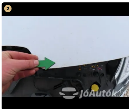
2 motorháztető apró kavics sérülések