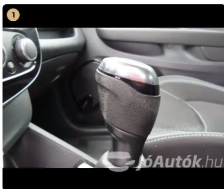
1 váltógomb kopott