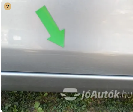
⚠ Karcok a jobb első ajtón