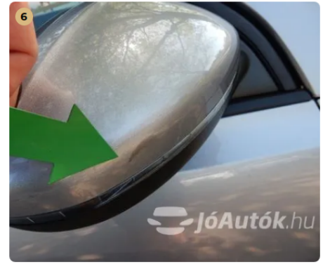
⚠ Horzsolás a jobb oldali