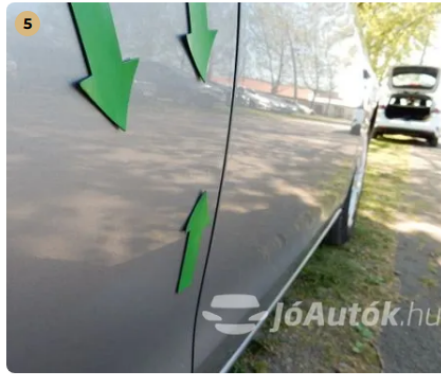
⚠ Három kisebb horpadás és fűjásnyomok a jobb hátsó ajtón