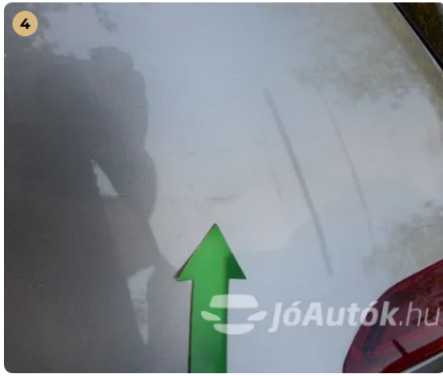
⚠ Karcok a jobb hátsó sárvédőn