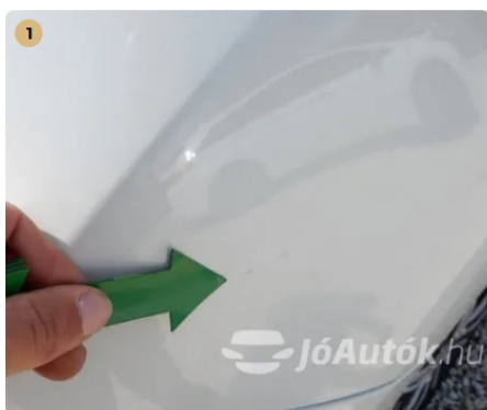
⚠️ Apró horzsolás a bal első sárvédőn