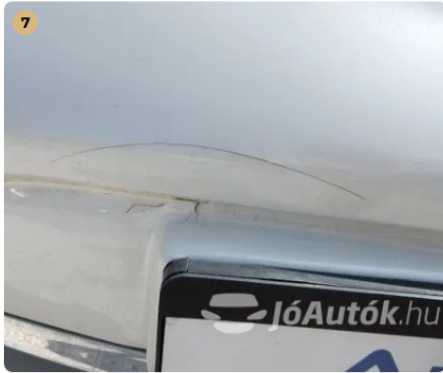
! Kisebb sérülés az első lökhárítón