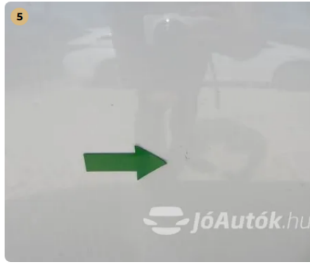
! Jobb hátsó ajtón apró karcolás