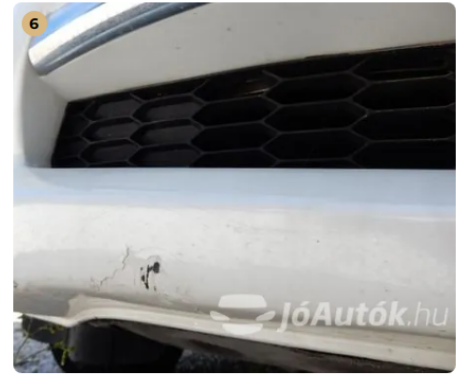
! Kisebb sérülés az első lökhárítón