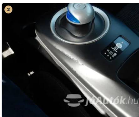
⚠️ Kopás a váltó körül