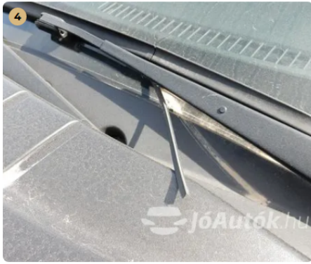
! Ablaktörlő lapát csereérett